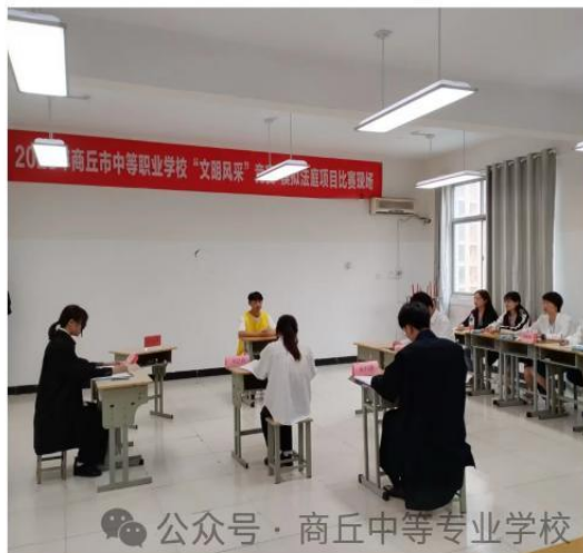
2025年商丘市技能大赛“文明风采”赛场